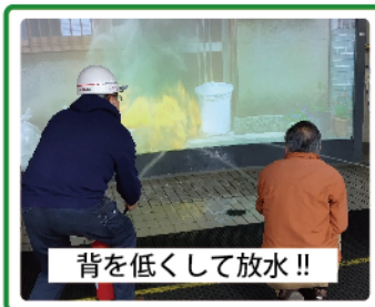
背を低くして放水!!

11月12日(日)、立川防災館にて今年度1回目の防災体験学習が開催され、子どもを含めて28名が参加しました。今回は、2つのグループに分かれてVR防災体験と救出救助体験、消火体験の各コーナーを巡る体験でした。