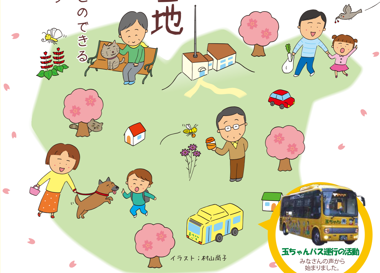
玉ちゃんバス運行の活動 みなさんの声から 始まりました。