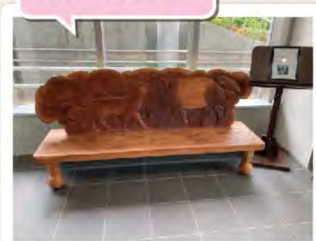
2021年5月 新コミュニティセンター B1 階 【ふれあう仲間達】 文化的な心の交流に 制作 前田忠一 寄贈 玉川学園町内会