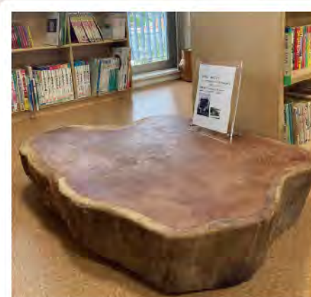
2021年5月 新コミュニティセンター こども図書室 【すわりんこ 時をこえて】 研磨と補修 子供たちと前田忠一 寄贈 玉川学園町内会