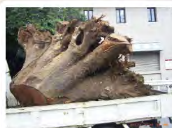
2017年 大樫枯死 伐採主幹と根本の保管を市に依頼する（町内会）町田市リサイクルセンターで乾燥保管