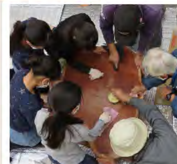
2020年秋 こどもたちとワックスをぬる （町内会コミュニティ部協賛）