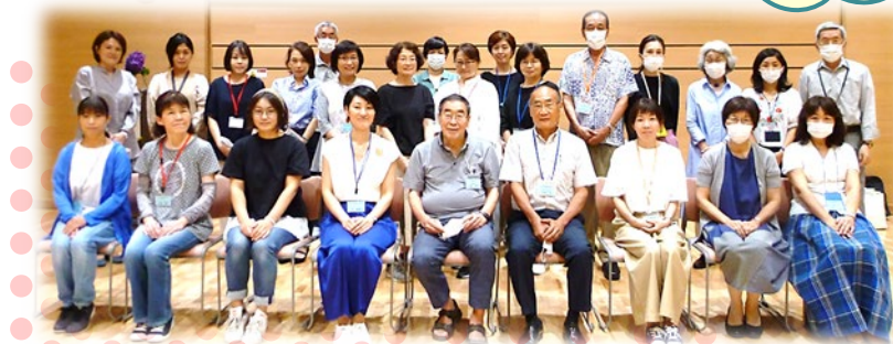
(写真は、6月11日にコミュニティ・センターで開かれた拡大役員会にお集まりの皆さんです。)