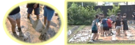
▲ 地域協力者の協力を得て行われた今年度の代掻きの様子