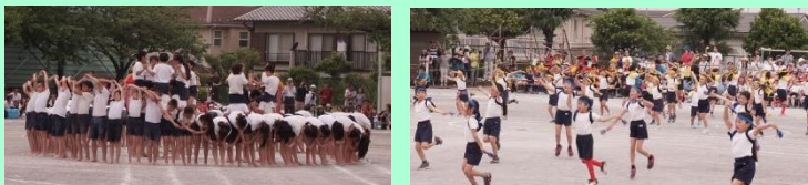
町田第五小学校運動会(5/26)