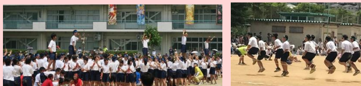
南大谷中学校体育祭(6/2)