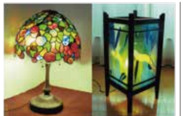
ガラス アート 住吉 富子 色と光を楽しむスタンドグラス