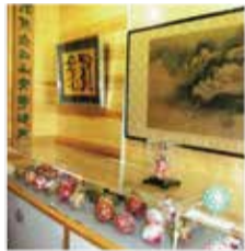
てまり 磯岡真理子 色を編む