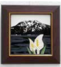
サンド プラスト 宮澤 浩 尾瀬のタイル彫刻 「なつかしの山・思い出の花シリーズ」