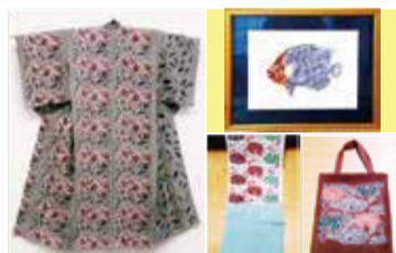
型染 後藤 典子 遊びごとと染め 身近な草花をデザインする