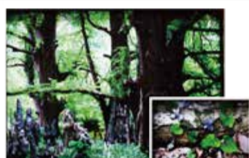
フォト デコパージュ 桑原 輝男 写真を組み立てる 写真を重ねることによって生まれる、不思議な立体感