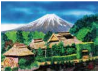
漆喰造形 絵画 鈴木 雅實 あづみ野 絵に漆喰をのせ、漆喰の厚みで遠近を表現