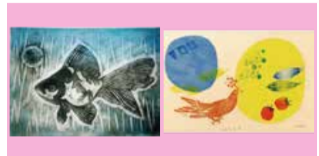
版画 ミルフィーユ The Harmony Land はあもにいらんど