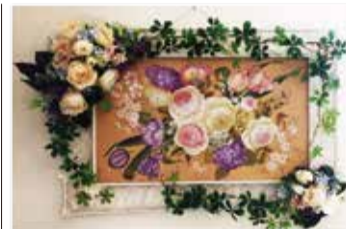
ビニール アトリエ紫苑 杉山みず江 手作り応援隊