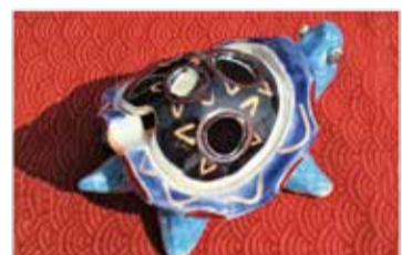
陶 ☆八陶☆ かけくらべ