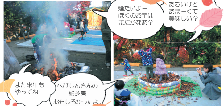
お芋が焼ける間にももろもろ葉っぱ遊び♪