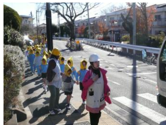
写真右・秩序正しく整然と 写真左・避難開始場所に集