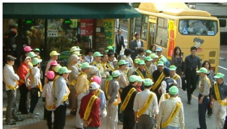
朝7時30分 第一陣集合